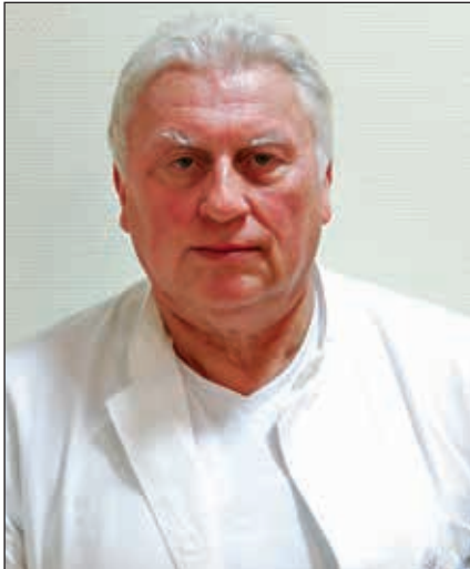
Klinik Kitzinger Land