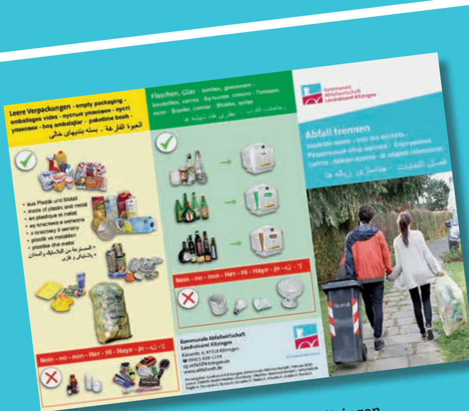
Die Ausgabe für den Landkreis Kitzingen

Damit Flüchtlinge und Zuwanderer in unsere Gesellschaft gut integriert werden können, ist es unverzichtbar, dass neben der Sprachschulung auch wichtige Alltagsabläufe und Lebensstile vermittelt werden. Zwar denkt man,