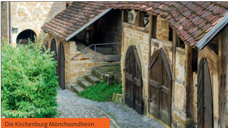
Die Kirchenburg Mönchsondheim

Engagiert hatten sich die Schüler auf das Thema «Online-Rassismus» vorbereitet. Teilweise setzten sie sich sogar mittels selbst produzierter Filmbeiträge damit auseinander. Der Wunsch nach Informationen wurde auch hier deutlich. Und so beschloss der Jugendkreistag, den Schulen zu empfehlen, sich regelmäßig mit dem Thema Rassismus zu beschäftigen. Möglich wären zum Beispiel Expertenvorträge, Podiumsdiskussionen und Aufklärung über das aktuelle Flüchtlingsthema. Auch die Teilnahme an dem Projekt «Schule ohne Rassismus – Schule mit Courage» wurde mit 65 Ja-Stimmen empfohlen.