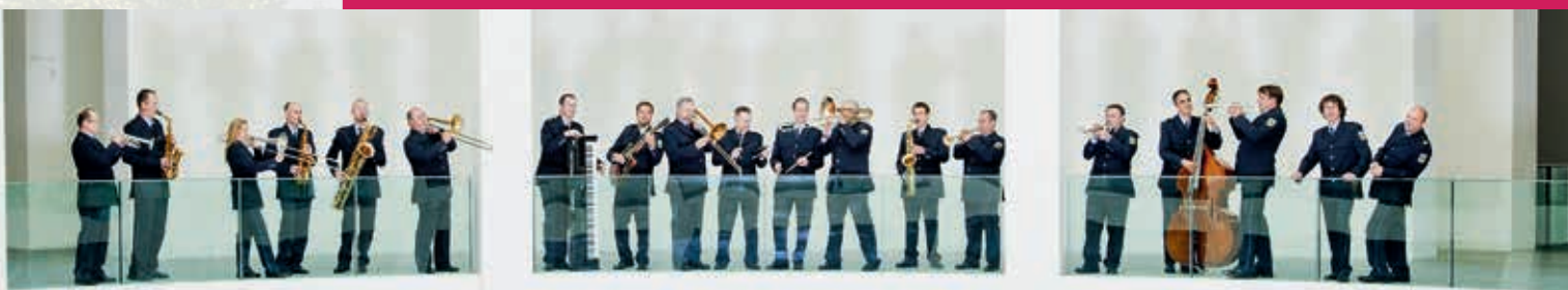
Bundespolizei Orchester München

Auftritt der Big Band der Bundespolizei mit Infostand der Bundespolizei